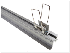
Tilbehør, I monterings-fjeder