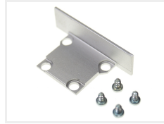
Tilbehør, I endekappe