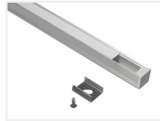
Anodiseret med hvid front, 2 meter