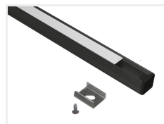
Sort med hvid front, 2 meter