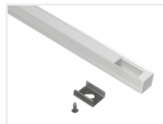
Hvid med frosted front, 2 meter